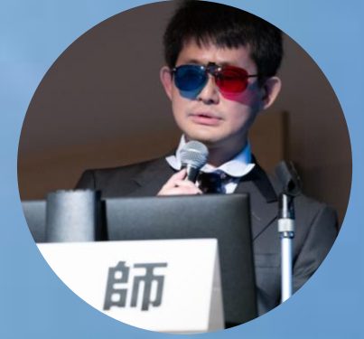
パシフィコ横浜で 講演する赤青メガネ