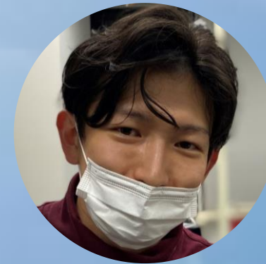
道東帰りの シゴデキ専攻医