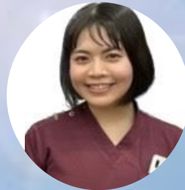
合唱日本代表 ×後期研修医 (アンコール登壇)