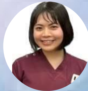
合唱日本代表× 後期研修医