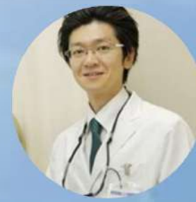
若き開業医× 凄腕サージャン