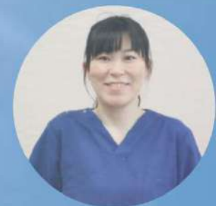
3児のママ× 聞こえの スペシャリスト